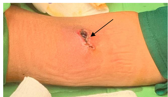
Gambar 1. Ruptur pseudoaneurisma AV Fistula Brachiocephalic

Saat pasien berada di IGD diberikan tindakan berupa cairan normal saline secara intravena, obat-obatan anti perdarahan, antibiotik, dan bebat tekan pada daerah tersebut. Pasien lalu dilakukan transfusi darah dan dijadwalkan untuk segera dilakukan operasi emergensi. Tindakan operasi dilakukan secara general anestesi dengan rencana rekonstruksi vaskular. Saat intraoperatif, didapatkan bahwa anastomosis telah terinfeksi yang dicurigai mengakibatkan pembuluh darah vena cephalic menjadi rapuh sehingga terbentuk pseudoaneurisma yang berakhir menjadi ruptur total pada vena. Keadaan ruptur total ini mengakibatkan anastomosis sudah tidak dapat diperbaiki atau diselamatkan. Di sisi lain, arteri brachialis yang tampak ruptur subtotal masih dapat diselamatkan sehingga pemilihan tindakan rekonstruksi dengan teknik side-to-side Vein Patch Plasty menjadi pilihan. Penggunaan graft dari vena saphena magna ( Great Saphneous Vein ) menjadi pilihan yang paling umum dipakai untuk tindakan vaskular.