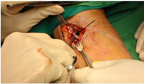
Gambar 2. Vena Cephalica ruptur total dan Arteri Brachialis ruptur subtotal

Pascaoperasi pada pasien didapatkan tanda vital stabil dan tidak ditemukan adanya komplikasi terutama tanda iskemia. Pasien lalu dirawat selama 3 hari untuk dilakukan pemantauan lebih lanjut lalu diperbolehkan untuk pulang dan dijadwalkan untuk rawat jalan. Saat kontrol rawat jalan 2 minggu kemudian tidak didapatkan tanda komplikasi seperti nyeri, infeksi, paresthesia, perdarahan pada daerah operasi, ataupun iskemia di daerah distal tangan pasien.