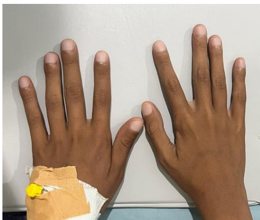
Gambar 1. Clubbing finger (+) pada 10 jari An.ZA

Pada pemeriksaan abdomen terlihat abdomen cembung, tidak ditemukan distensi, bising usus 10x/menit, nyeri tekan (-), hepatomegali (-), splenomegali (-), dan pada pemeriksaan perkusi didapatkan timpani pada seluruh regio abdomen. Pada pemeriksaan ekstremitas superior dan inferior didapatkan akral hangat, CRT <2 detik, dan tidak didapatkan edem. Namun, ditemukan adanya clubbing finger pada 10 jari ekstremitas superior dextra dan sinistra.