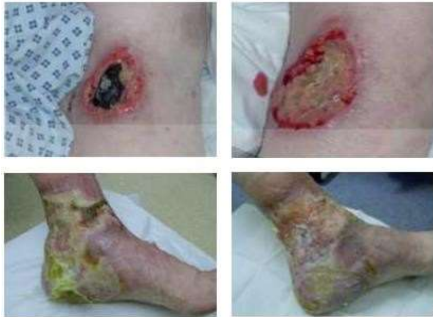
Gambar 2. Hasil Penelitian Acton & Dunwoody tahun 2008. 11