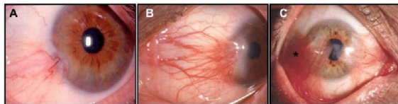
Gambar 1. Klasifikasi pterigium menurut Tan 16

pembuluh episkleral sebagai tempat tembus cahaya. Dengan demikian, mereka mengklasifikasikan pterigia dengan pembuluh episklera yang terlihat di bawah tubuh dinilai sebagai T1 atau pterigia atrofi. Di kelas T3, semua pembuluh episklera dikaburkan oleh jaringan fibrovaskular buram dari tubuh pterigium. Pterigia lain yang tidak termasuk dalam dua kelas ini adalah dikategorikan sebagai kelas T2. 16